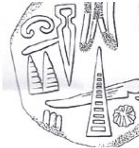
Fig. 3 : l’extrémité du signe *278 (= li) séparant les signes REGIO et DOMINUS (copie de la bulla n°657)

Le deuxième terme a été translittéré MAGNUS.PITHOS+RA/I par J.D. Hawkins, avec réserve 17 . Il soulignait toutefois que le signe MAGNUS est toujours placé en décalage au-dessus du signe *383 (= +ra/i) 18 . Cela laisse un doute sur la translittération proposée, qui pourrait aussi être lue dans le sens PITHOS+ra/i.MAGNUS. On peut aussi remarquer que, dans l’empreinte n°657, le signe *278 (= LI) de l’anthroponyme central s’allonge à son extrémité jusqu’à venir séparer le signe REGIO du signe DOMINUS (cf. Fig. 3). Ce dernier devient de cette manière un élément externe au groupe PITHOS + *383 (= +ra/i) - MAGNUS - REGIO. Nous proposons par conséquent de faire du signe REGIO un déterminatif postposé au groupe PITHOS + ra/i - MAGNUS, et d’interpréter l’ensemble comme étant la désignation d’une région hittite. Cette région (PITHOS+ra/i.MAGNUS REGIO ) aurait été administrée par un personnage du nom de TONITRUS URBS +li, identifié nous l’avons vu avec le prince Nerikkaili 19 . Le signe DOMINUS détermine en effet dans notre hypothèse l’ensemble du toponyme, et non le seul signe REGIO comme imaginé précédemment par J.D. Hawkins dans sa lecture REGIO.DOMINUS « gouverneur ».