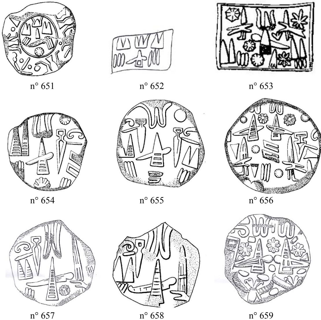
Fig 2 : Copie des bullae de TONITRUS URBS +li au Nişantepe

discussion car, dans l'état actuel de la documentation, ils ne sont attestés que dans ce corpus très limité.