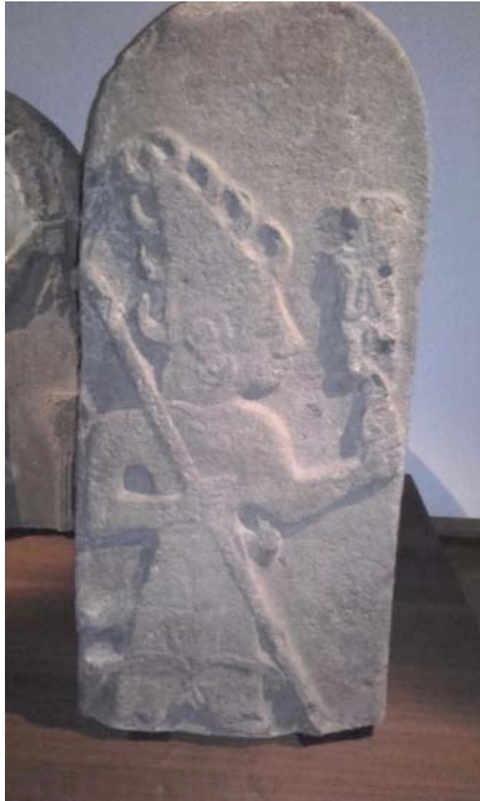
Fig. 1 : la stèle de Çağdın

(photo ©E. Van Quicquelberghe, exposition Europalia Turquie, 2017)