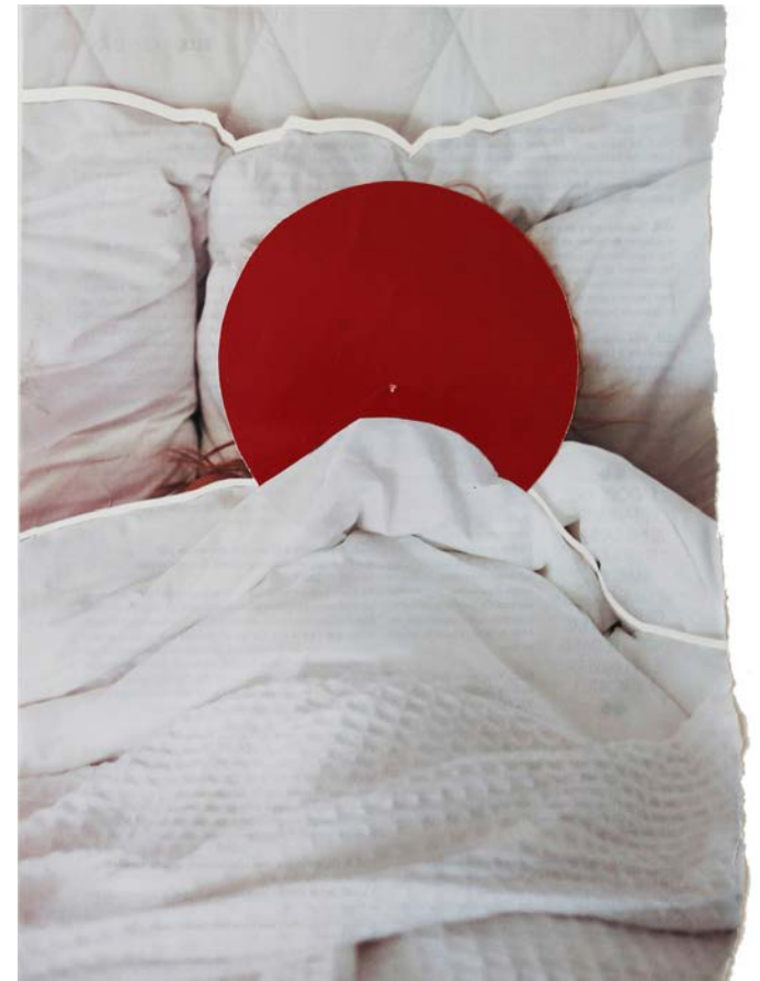
Klewiec Kévin_Lemps Tancre Robin_coucher de soleil