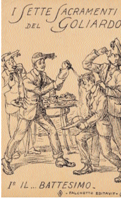
Collezioni cartoline Dono Russo II/ 012.Russo.II Archivio Storico, Bologna

Des milliers de jeunes y ont défilé, ont mis en place des règles de vie commune, des rites, des cérémonies pour donner un sens à leur